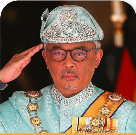
السلطان عبد الله سلطان أحمد شاه ملك ماليزيا

من بين خريجي ألدنهام المتميزين: البارونة كارين برادي، ومات والاس، وشخصيات ملكية عالمية من بينهم ملك ماليزيا، ولاعبو نادي أرسنال لكرة القدم مثل مايلز لويس-سكييلي وتشارلي باتينو.