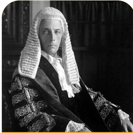
شبكة خريجين عالمية مدى الحياة الفيكونت الأول باكماستر والمستشار الأعلى لبريطانيا العظمى