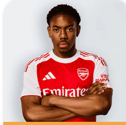
مايلز لويس-سكييلي لاعب كرة قدم إنجليزي محترف