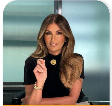
كارين برادي لاعب كرة قدم إنجليزي محترف